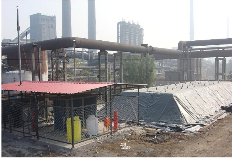
图 3 生物堆工程实际现场图